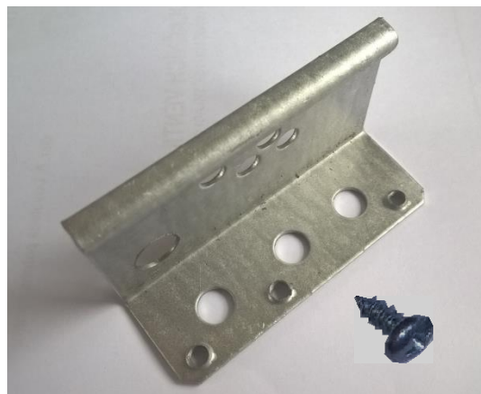
Doplnění pro 14 (T)X.A, (T)XZ.A