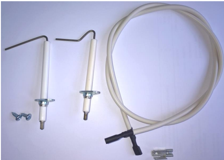
Set pro 20 a 28 kW